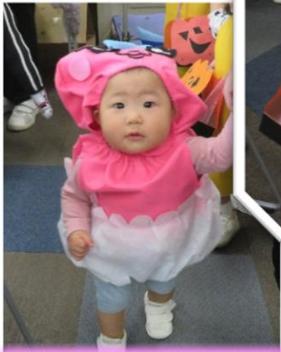
おぱんちゅうさぎ