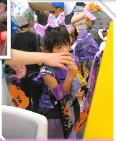
天才的なアイドル様♡