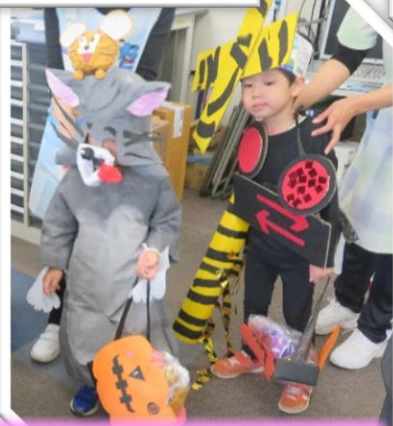
トム&ジェリー&踏切マン