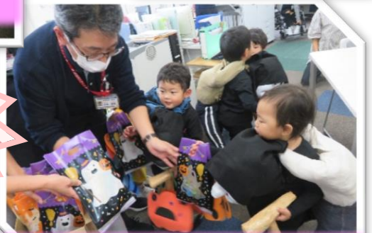
お菓子くれなきゃイタズラだ!